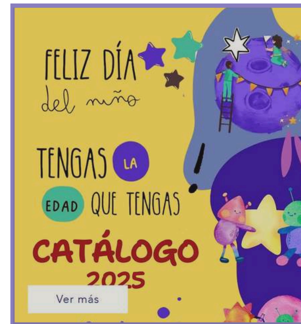
Día del Niño