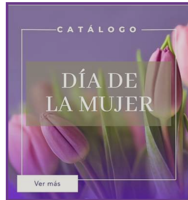
Día de la Mujer