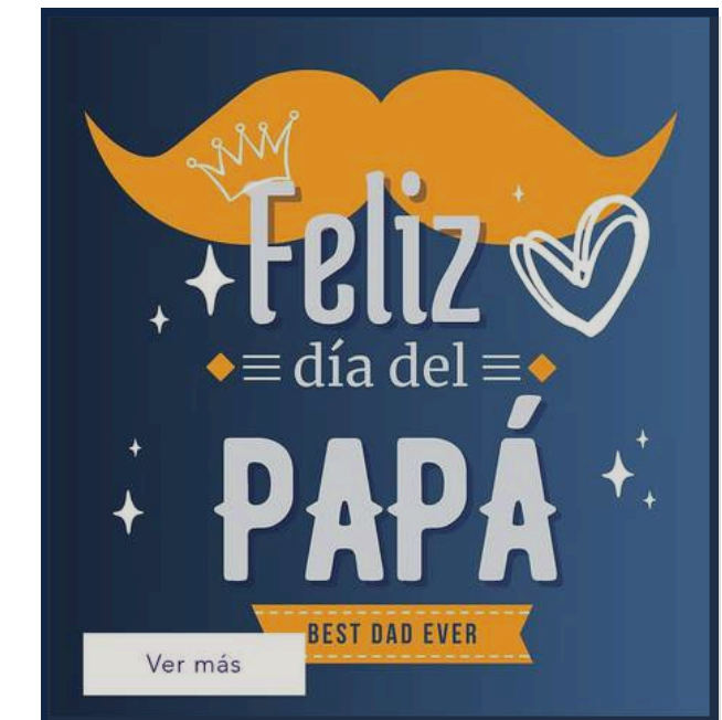
Día del Papá