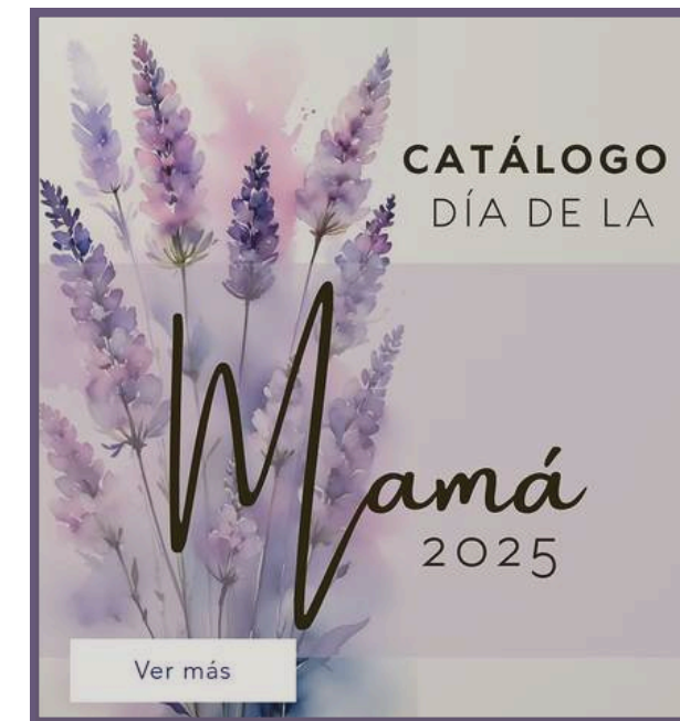
Día de la Mamá